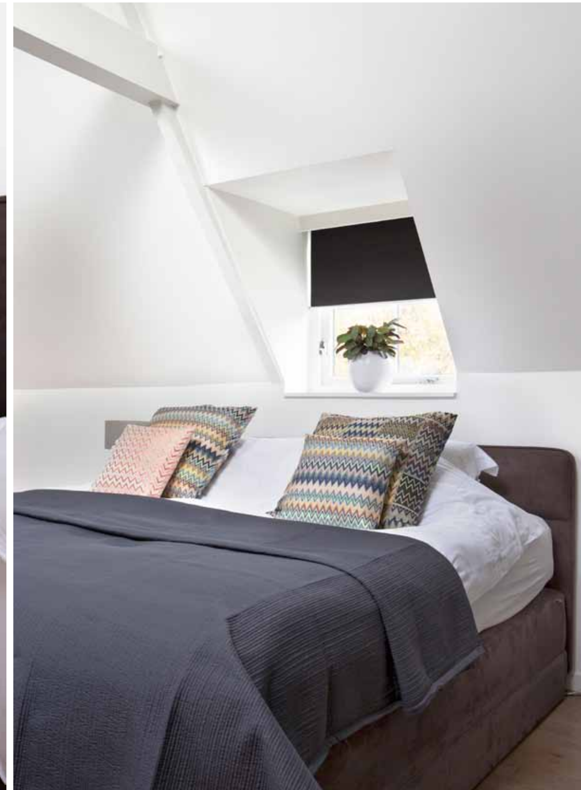
Het bed is van Vi-Spring. De schitterende kussens zijn van Missoni Home. In de slaapkamer ligt een eikenhouten vloer van Di Legno via Soares Parket. De hanglampen in de slaapkamer zijn van Kreon.