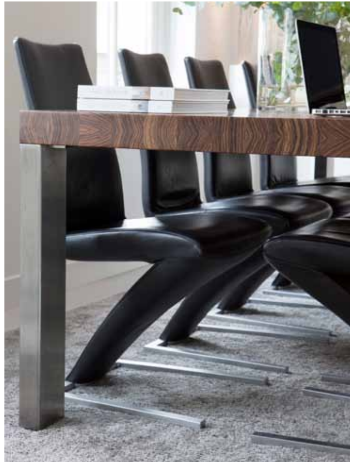
Het blad van de eettafel is van Zebrano hout. De bewoners kregen het van een vriend. Het rvs onderstel is gemaakt door RVS Style 4 Ever. Om de eettafel staan acht leren eetkamerfauteuils van Rolf Benz, een cadeau van de vader van de eigenaar. De zwevende kast aan de muur werd gemaakt door André Manten. De eettafel staat op een tapijt van BIC Carpets.

Het huis lijkt in niets meer op wat het ooit was: van buiten karakteristiek, met roedeverdeelde ramen en een mooie oude gevel, maar van binnen bestond het uit verschillende appartementen en kamers. Toen de huidige eigenaar, die jarenlang het 'kleinste' kamertje op zolder bewoonde, hoorde dat de benedenbuurvrouw zou verhuizen en niet veel later ook het huis van de burens te koop kwam, greep hij zijn kans. "Ik woonde al een tijd samen en mijn vriendin en ik hadden inmiddels twee prachtige dochters gekregen. Het 'op kamers wonen' wat wij deden, begon wat krap te worden."